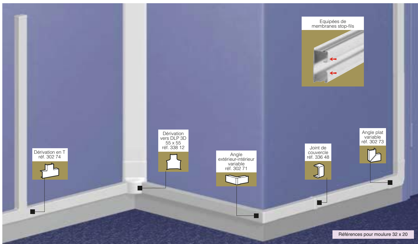
Tableau de capacité (p. 722-723) Tableau de choix (p. 724 à 727) - Principes d'installation (p. 729)